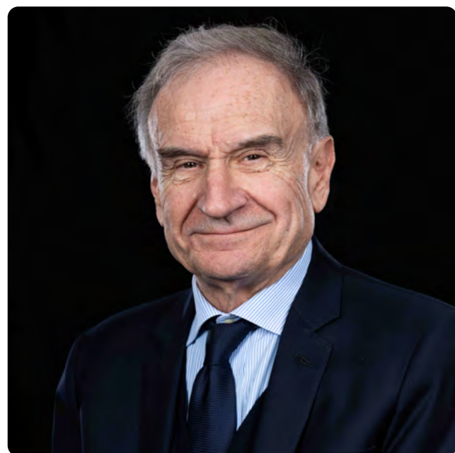
Gianni Petrucci Presidente FIP

Le Finali Nazionali sono un network, una rete di agonismo (e non di antagonismo), di valori e di possibilità di crescita personale, tecnica e sociale per i ragazzi e le ragazze partecipanti. Quelle attuali sono il risultato del lavoro di tanti anni da parte di tecnici, di consiglieri e di dirigenti federali, così come dei tanti organizzatori locali, che hanno aggiunto, di volta in volta, impegno, serietà, professionalità, consentendoci di offrire un prodotto performante in ogni punto del network, nelle diverse città d'Italia.