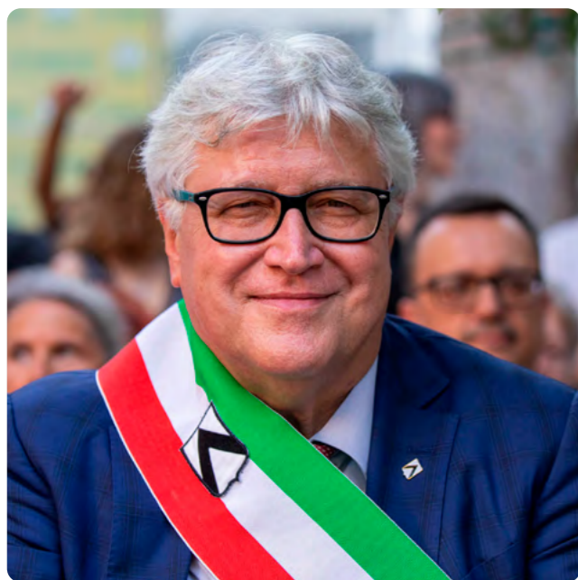
Alberto Felice De Toni Sindaco di Udine

È con grande piacere che accogliamo a Udine le finali nazionali Under 15 di pallacanestro. La nostra terra da sempre ha nutrito una grande passione per questa disciplina e nel passato come oggi continua a sfornare grandi campioni che poi arrivano ai vertici del basket italiano e internazionale. Segno di un movimento che funziona, che attrae, che insegna valori che vanno oltre lo sport inteso come competizione. E' per questo che auguro a tutti i partecipanti non solo di dare il meglio di sé sul parquet ma anche di divertirsi, solidarizzare, aiutare, creare legami e amicizie. Insegnamenti che vanno oltre le vittorie. Un grazie di cuore per essere a Udine a tutte le società presenti, grazie agli organizzatori e alla Federazione.